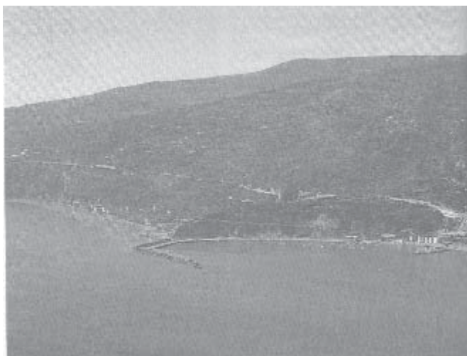
Maratea, nel Golfo di Policastro

Alla luce della situazione attuale, appare certo che la conservazione delle qualità paesaggistiche rivesta un ruolo di estrema importanza per lo sviluppo turistico della nostra regione.